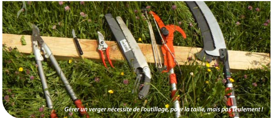
Gérer un verger nécessite de l'outillage, pour la taille, mais pas seulement !

Aussi bien chez nos voisins suisses que chez nous en Franche-Comté, le constat est le même : les vergers de plein champ se raréfient et leur niveau d'entretien ne cesse de se dégrader. Cela est d'autant plus prononcé chez nous du fait, entre autres, d'un contexte différent (agriculture, urbanisme, contexte socio-économique). Pour essayer de contrer cette tendance, il est proposé dans le cadre du programme verger franco suisse une mesure d'aide financière à destination des « gestionnaires » de verger.