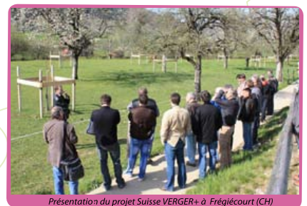
Présentation du projet Suisse VERGER+ à Fréglécourt (CH)

Vous l'aurez compris, ce programme ambitieux est une chance pour notre association, une racine supplémentaire à notre arbre pour nourrir notre projet de préservation du patrimoine fruitier.