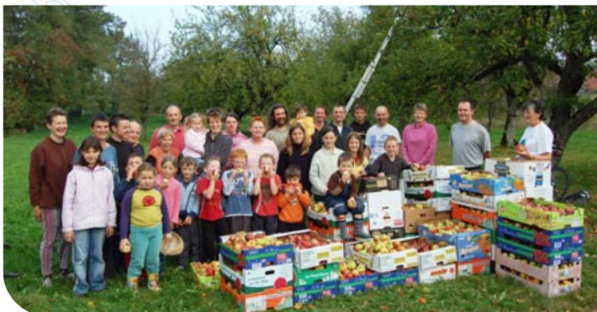
La récolte, un moment convivial partagé avec les enfants de Vandoncourt

L'histoire biblique nous enseigne que l'Homme a perdu son coin de paradis en croquant dans le fruit défendu, le prix à payer pour accéder à la connaissance. Retenons que le paradis est planté d'un verger (comment pourrait-il en être autrement ?) et que c'est dans ce verger que l'Homme a initié une quête éternelle du savoir... Alors perdu pour perdu, continuons à y croquer sans fin les fruits de la connaissance !